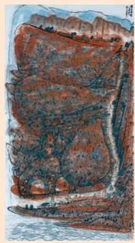
1985年作品《黃土高原》，現藏香港藝術館。