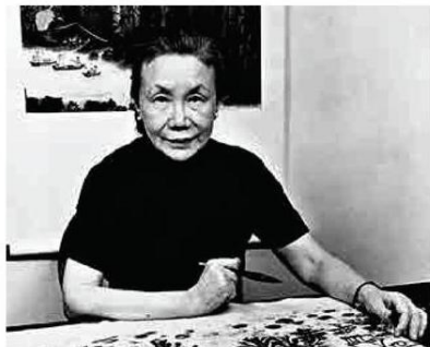
▶方召慶一生酷愛書畫藝術，即使年邁依舊堅持創作 資料圖片

此外，方召慶基金會現正與香港賽馬會及亞洲協會香港中心（Asia Society）聯合舉辦「道無盡：方召慶水墨畫展」，展出超過六十件作品，當中包括四十八件方召慶真跡以及印章、照片、獎狀等個人物品，力求讓更多人了解真實的方召慶藝術。